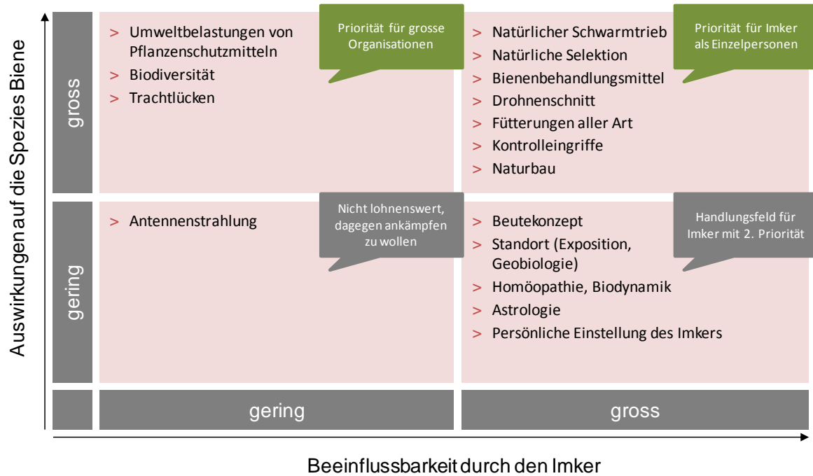
BEEINFLUSSBARKEITS- UND AUSWIRKUNGSMATRIX: WELCHE FAKTOREN KÖNNEN ÜBERHAUPT BEEINFLUSST WERDEN UND WIE STARK WIRKEN SICH DIESE AUS.

Beeinflussbare und nicht beeinflussbare Faktoren können sich positiv und negativ auswirken. Die Auswirkungen können kurzfristig oder langfristig sein. Je langfristiger und stärker (also oben ganz links oder ganz rechts) die Auswirkung, umso wichtiger der Faktor für die Arterhaltung der Biene!